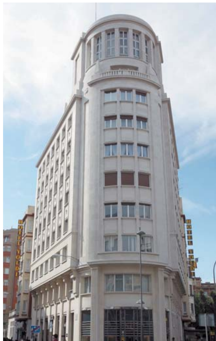
EDIFICIO AURORA. De Víctor Eúsa, 1950. "Emplea una sintaxis mucho más contenida que en sus realizaciones anteriores a la Guerra Civil". CALLEJA