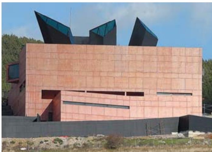
MUSEO OTEIZA. De Sáenz de Oiza. "El empleo de un único material, tanto en el exterior como en las salas, con textura acusada y sin acabados posteriores, refuerza su valor escultórico y su poderosa plasticidad". DN