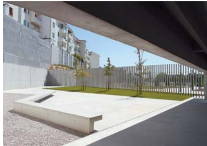
ESCUELA INFANTIL DE LA MILAGROSA. De los arquitectos Carlos Pereda y Óscar Pérez Silanes, obra del año 2011 con múltiples premios. NOEMÍ LARUMBE