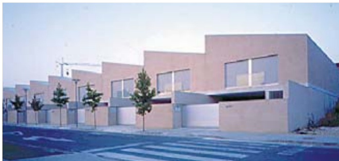
VIVIENDAS PARA PROFESORES DE LA UPNA. De Javier Pérez Herreras y José V. Valdenebro. "Perfil ascético que valora la concisión del gesto formal que construye el proyecto". DN